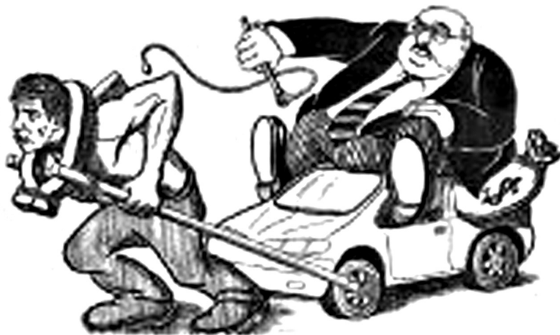
Единство рабочего с буржуем

ство, большую часть которого присваивают себе чиновники и капиталисты. Те, кто сейчас имеет власть и деньги, хотят, чтобы простой народ отдавал им свои гроши, сидел у телевизора и молчал. А для тех, кто